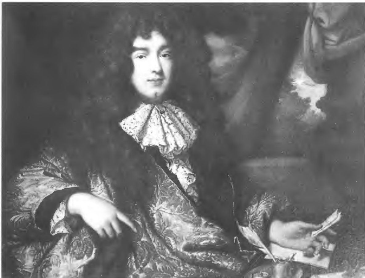
Jean Baptiste Colbert, quizás el ministro más importante de Francia durante el reinado de Luis XIV (por Nattier, Museo de Versalles)

Saint-Simon —orgullosa representante de la más linajuda aristocracia— llamaría con desprecio un reinado de viles burgueses .